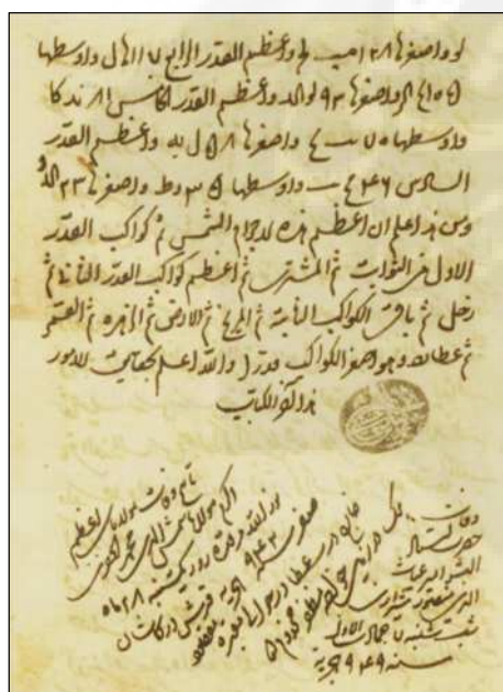
برگ پشت انتهای نسخه خطی شماره ۸۲۸ مجموعه طباطبایی کتابخانه مجلس

شمس‌الدین محمد بن احمد خفری (د ۹۴۲ یا ۹۵۷ق) حکیم، ریاضیدان و از دانشمندان برجسته هیئت و نجوم است که در نیمه دوم سده ۹ قمری در شهرستان خفر استان فارس به دنیا آمد. در شیراز تحصیل کرد و بعدها به کاشان سفر کرد و به تألیف و تدریس پرداخت و تا آخر عمر در کاشان زیست. وی شاگرد سید صدرالدین محمد دشتکی (۸۲۸-۹۰۳ق) و استاد شاه