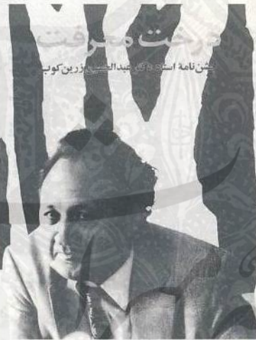
عنوان کتاب «زندگی زرین کوب»

دانشجویان بشوخی از استاد خود پرسیدند که در کار علم چگونه می تواند به مقام بزرگانی چون پاولوف رسند. استاد بجد پاسخ داد: بامداد در آغوش مسئله مطلوب خود از خواب بیدار شوید، با مسئله خود صبحانه بخورید، با آن به